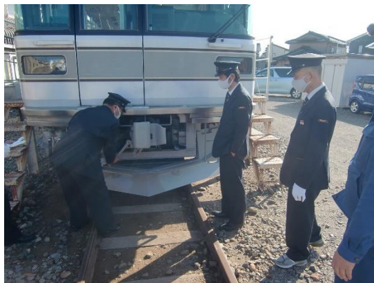
運転事故防止教習