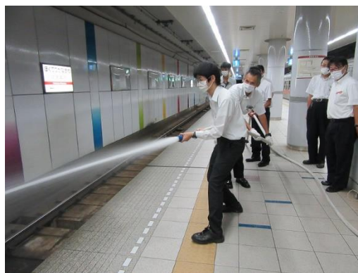
北鉄金沢駅消防設備訓練