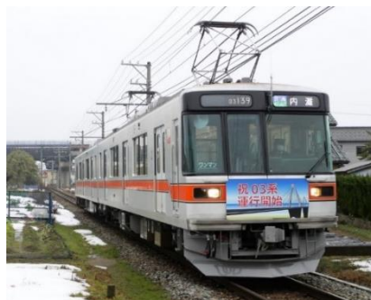
新型車両03系営業運転