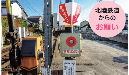
踏切内で停滞した際は迷わず非常ボタンを押してください。事故防止にご協力をお願いします。