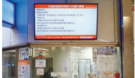
北鉄金沢駅や野町駅などには、バス・鉄道の運行状況が分かるサイネージを表示しています。

冬季の鉄道は、多少の遅れが発生することはあるものの、規模の大きな雪害等がない限り、定時性を守りながら運行しております。雨の日も、風の日も、大雪の中でも多くのお客様を目的地まで安全に送り届ける鉄道は、さまざまな安全対策や事前準備に支えられ運行しています。