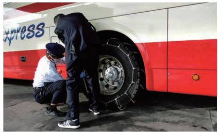
降雪時に備えてタイヤチェーンの脱着教習を適宜実施しています。