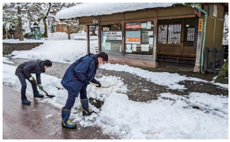
降雪量が多い時は、従業員が状況に応じてバス停周辺の除雪を行っています。

冬季のバスは、道路状況等により遅延や運休などが発生することもあり、ご利用のお客様にはご不便をおかけし、大変申し訳ございません。一人でも多くのお客様にご利用いただくため、迂回運行や一部バス停の休止を実施しながらも、安全第一に路線バスの運行継続に努めてまいりますので、何卒ご理解賜りますようお願いいたします。