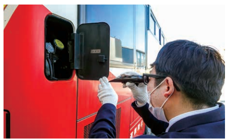
エンジンを冷却するための冷却液が凍結しないよう、濃度の数値が適切かどうか確認しています。