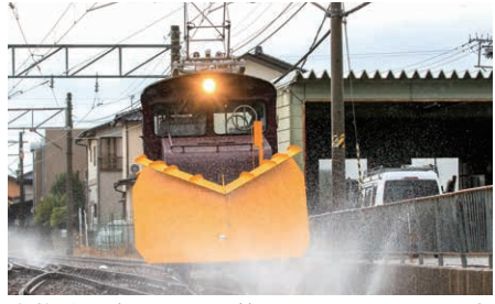
本格的な冬を迎える前に、除雪用ラッセル車(ED201)の試運転を実施しています。