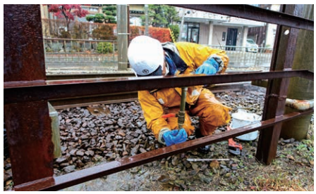
スプリンクラーが正常に作動するかどうかを一つひとつ手作業で確認しています。