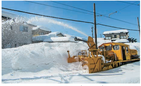
ED201のほかに除雪用ディーゼルモーターカー(DL71)も活躍しています。

冬季の鉄道は、多少の遅れが発生することはあるものの、規模の大きな雪害等がない限り、定時性を守りながら運行しております。雨の日も、風の日も、大雪の中でも多くのお客様を目的地まで安全に送り届ける鉄道は、さまざまな安全対策や事前準備に支えられ運行しています。