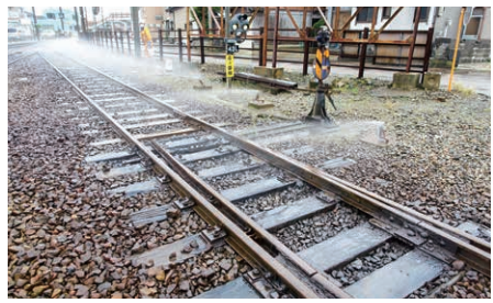
雪づまりによるポイント不転換などを防ぐためにスプリンクラー稼働しています。