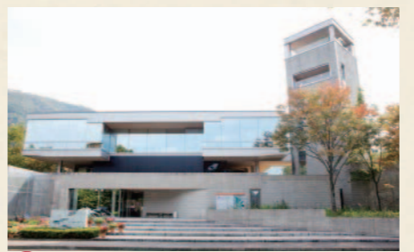
C ふれあい昆虫館 ふれあい昆虫館 世界中の昆虫が展示されている県立の博物館。千匹の蝶が舞う「チョウの園」をはじめ、学習・情報コーナーが充実しています。