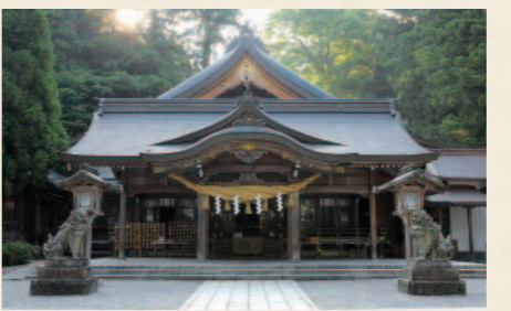
D しらやま ひめ じんしゃ 白山比咩神社 霊峰白山を神体山とする全国三千社の白山神社総本宮。加賀の国の一ノ宮として敬われ、「しらやまさん」と呼ばれて親しまれています。