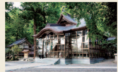
A きんげんぐう 金劔宮 古くは「劔宮(つるぎのみや)」と呼ばれ、鶴来(つるぎ)という地名の由来となっています。近年は金運アップで注目されています。