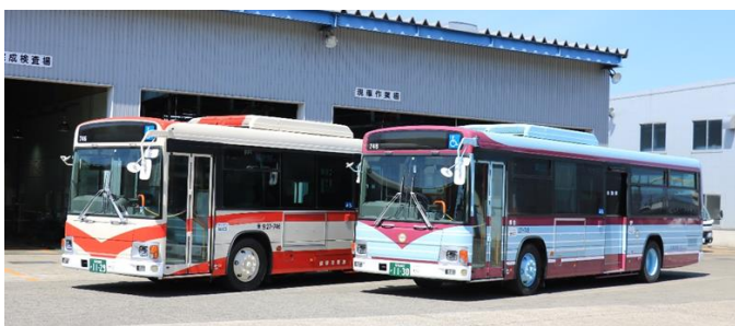
復刻赤帯カラー（27-746）写真左 昭和 40 年代頃に「青バス」に代わり採用された北鉄バスの代名詞ともいえるカラーです。