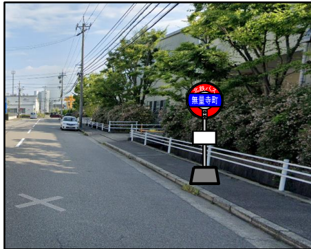
金沢港クルーズターミナル方向バス停