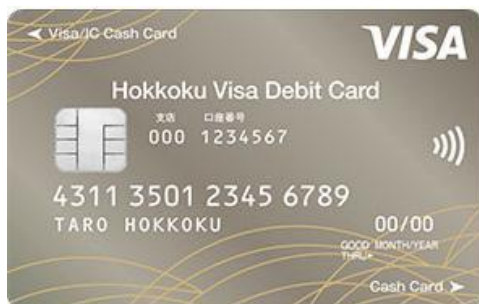
【北國 Visa デビットカード】