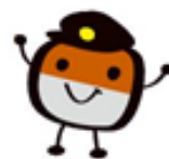
石川線・浅野川線利用促進キャラクター「のるぞう」

※取り扱いを終了する乗車券以外は、既存の企画乗車券、回数券、定期券は継続販売します。