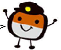
石川線・浅野川線利用促進キャラクター「のるぞう」