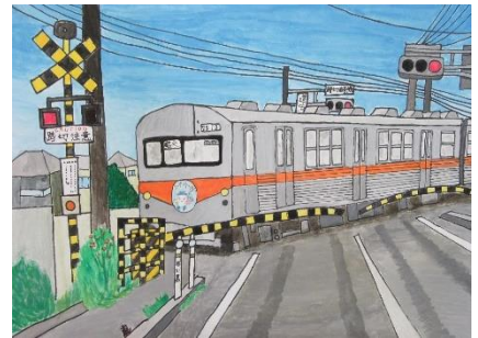
昨年度 最優秀作品

《応募先・お問い合わせ》 〒920-2133 白山市鶴来大国町二の13-1 北陸鉄道(株)鉄道部 TEL:076-272-2221