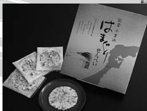
全国でも珍しい一品 ●はまぐりせんべい