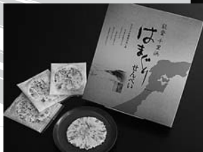
全国でも珍しい一品 ●はまぐりせんべい