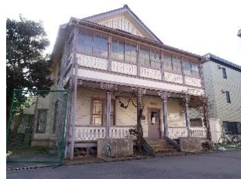
北陸学院ウイン館

1888年(明治21年)アメリカ人宣教師「トマス・ウイン」によって建てられました。