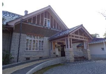
石川県立美術館広坂別館

1888年(明治21年)アメリカ人宣教師「トマス・ウイン」によって建てられました。